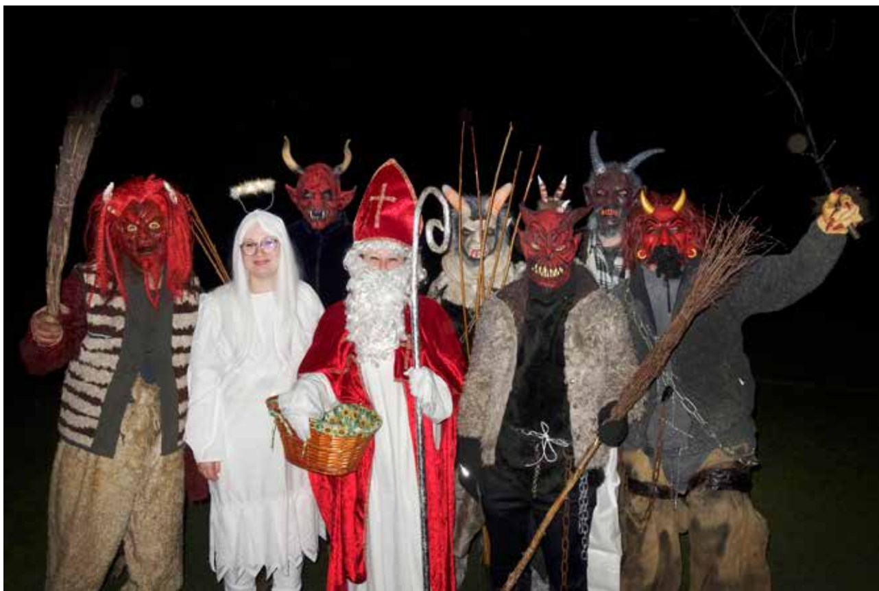
Dubští čerti vám přejí úspěšný rok 2026