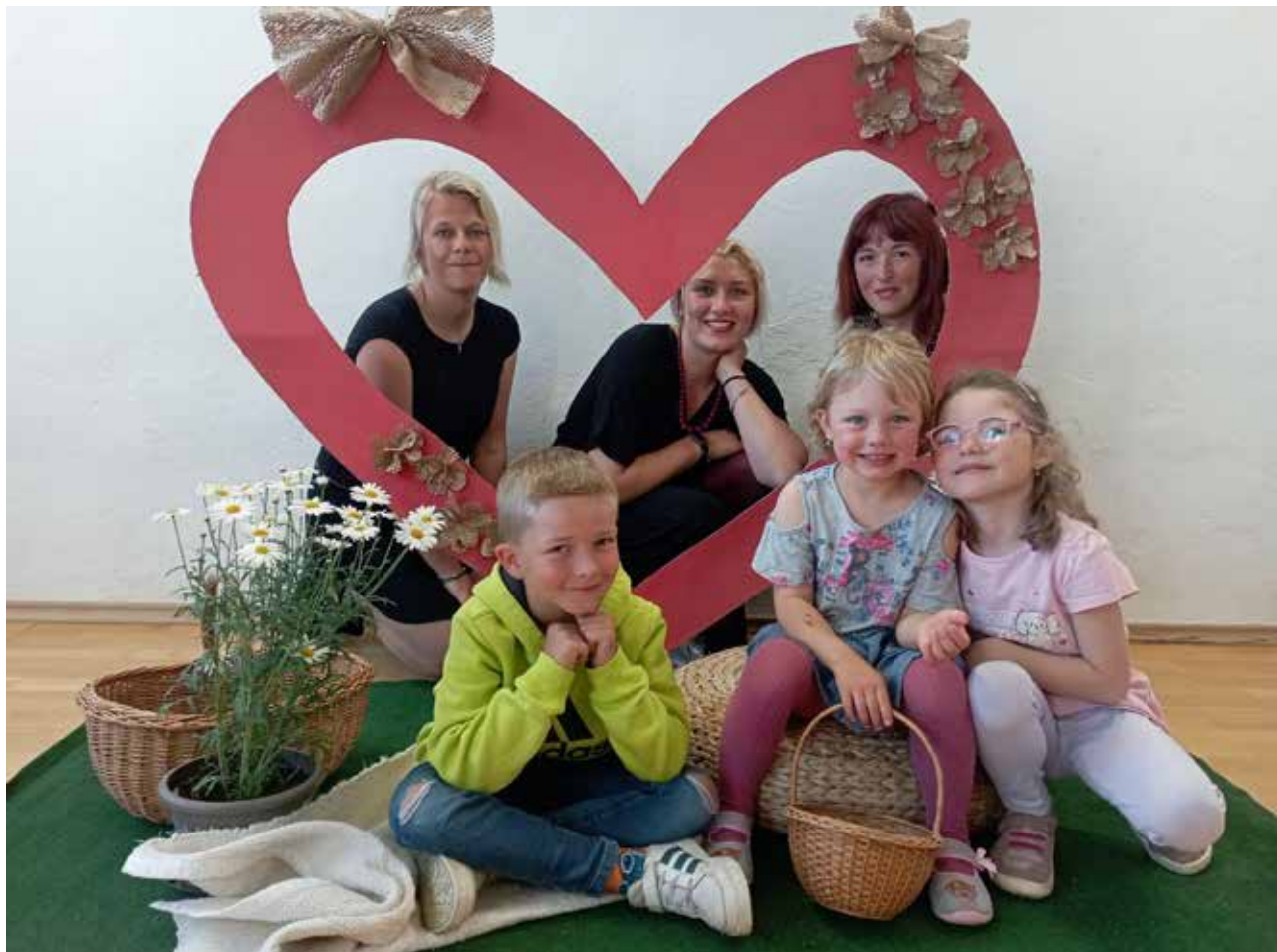
Den matek se již tradičně slaví druhou květnovou nedělí i v naší ZŠ (více na str. 7)