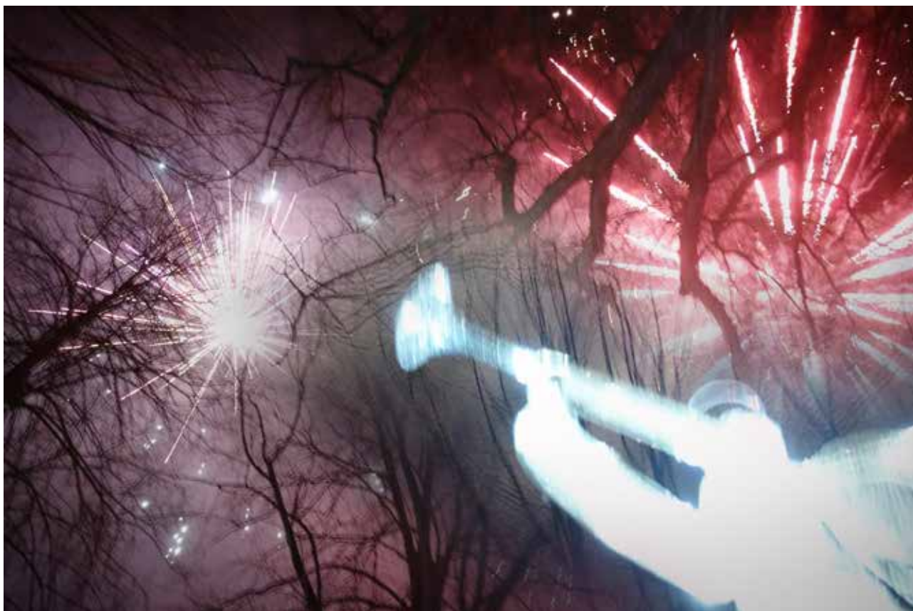
Ohňostroj na náměstí Dubu u příležitosti příchodu nového roku 2025