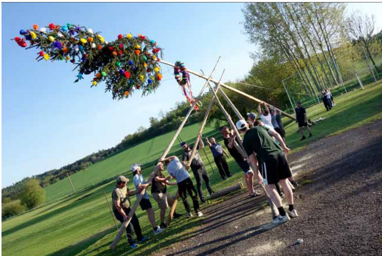
Tradiční stavění májky (30.4.2025) - více fotografií na str. 8