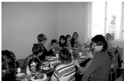
Mikulášské vaření

Dne 4. 12. 2008 se v MC Dupy Dub konalo „mikulášské vaření“. Pozvali jsme děti z naší základní školy, ale zváni byli samozřejmě všichni, kdo měli chuť si „zakuchtit“. Celou akci jsme pojali ve stylu studené kuchyně z důvodu bezpečnosti, jelikož jsme očekávali i návštěvu maminek s nejmenšími dětmi. Děti přišly ve 14 hodin se svou paní družinářkou, a hned se pustily s chutí do práce. Z toaštových chlebů tak byly za okamžik Mikulášové a čerti. Čerti – chleby namazané Nutelou měly i rohy (z lentilek) a Mikulášům přibyla čepice z tvrdého sýru. Chleby jsme dělali na sladko i na slano, mnozí však kombinovali a tak vznikaly zajímavé výtvary. Veškeré dobroty po shlédnutí skončily v bříškách našich kuchtíků spolu s teplým čajem. Myslím, že se nám tato akce povedla a děti pobavila. Nakonec všichni pomohli umývat nádobí a uklidit prostor. Příští rok si to jistě s chutí zopakujeme, a přidáme vyprávění o tom, proč vlastně Mikuláš, čert a anděl za našimi dětmi chodí. ☒