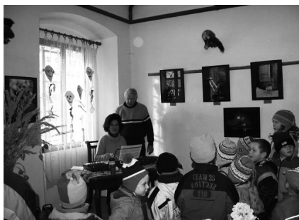
Společné zpívání koled