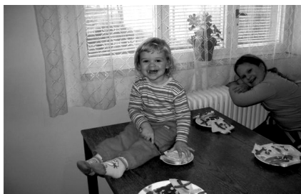
Nejmladší kuchařka Terežka