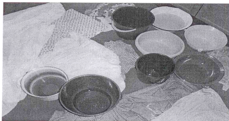
„výstavka“ nádob na chytání vody v bytě u ředitelky školy